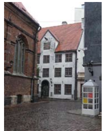
Historisch centrum van Riga.